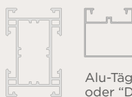
Alu-Trägerprofil "Die Mittlere" 9522 oder "Die Große" 9524