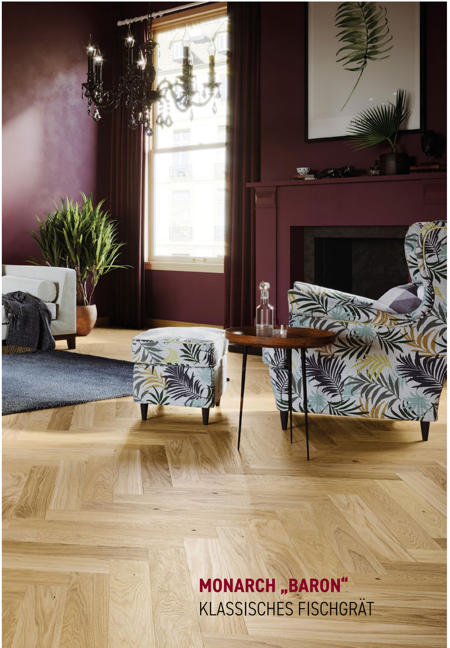
MONARCH „BARON“ KLASSISCHES FISCHGRÄT